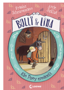
Bulli & Lina (Band 4) - Ein Pony ermittelt