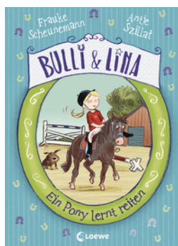
Bulli & Lina (Band 2) - Ein Pony lernt reiten