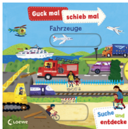
Guck mal, schieb mal! Suche und entdecke - Fahrzeuge