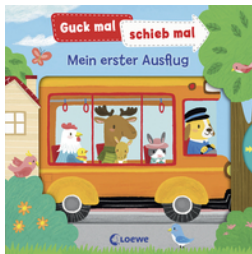
Guck mal, schieb mal! - Mein erster Ausflug