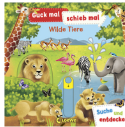
Guck mal, schieb mal! Suche und entdecke - Wilde Tiere