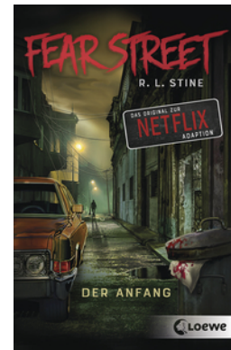
Fear Street - Der Anfang