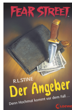
Fear Street 59 - Der Angeber