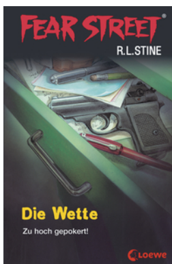
Fear Street 56 - Die Wette