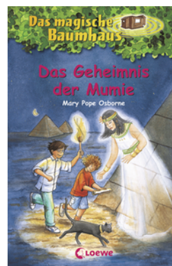
Das magische Baumhaus (Band 3) - Das Geheimnis der Mumie