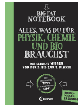
Big Fat Notebook - Alles, was du für Physik, Chemie und Bio brauchst - Das geballte Wissen von der 5. bis zur 9. Klasse. Mit Bonuswissen: Erdkunde