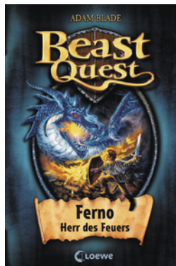
Beast Quest (Band 1) - Ferno, Herr des Feuers