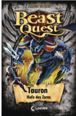
Beast Quest (Band 66) - Tauron, Hufe des Zorns