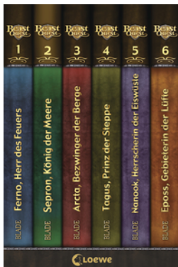
Beast Quest (Band 1-6)