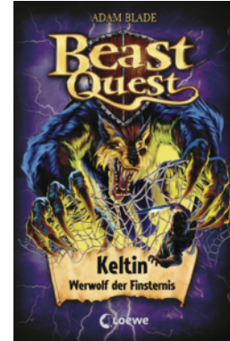
Beast Quest (Band 68) - Keltin, Werwolf der Finsternis