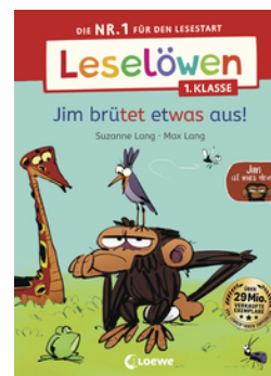
Leselöwen 1. Klasse - Jim ist mies drauf - Jim brütet etwas aus!