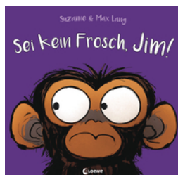
Sei kein Frosch, Jim!