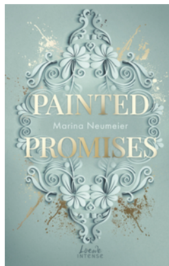
Painted Promises (Golden Hearts, Band 3)