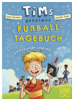
Tims geheimes Fußball- Tagebuch (Band 1) - Elf Freunde und ich!