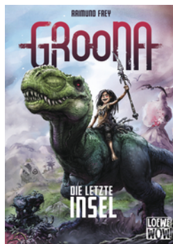
Groona - Die letzte Insel