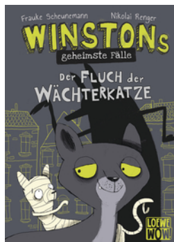
Winstons geheimste Fälle (Band 1) - Der Fluch der Wächterkatze