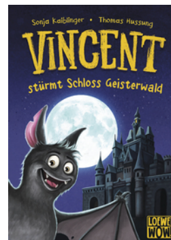
Vincent stürmt Schloss Geisterwald (Band 4)