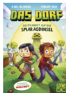
Das Dorf (Band 1) - Gestrandet auf der Smaragdinsel