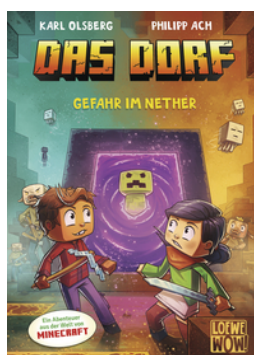
Das Dorf (Band 2) - Gefahr im Nether