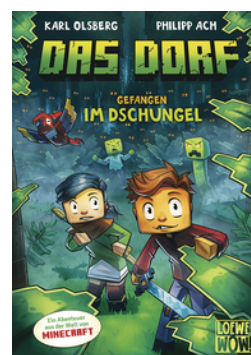
Das Dorf (Band 3) - Gefangen im Dschungel