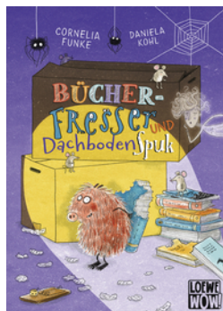
Bücherfresser und Dachbodenspuk