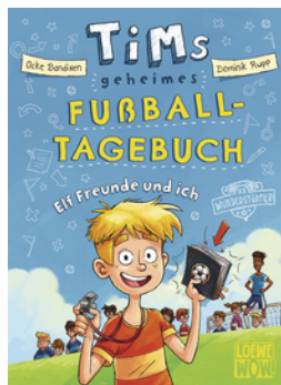
Tims geheimes Fußball- Tagebuch (Band 1) - Elf Freunde und ich!