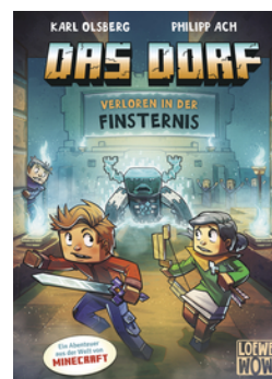
Das Dorf (Band 6) - Verloren in der Finsternis