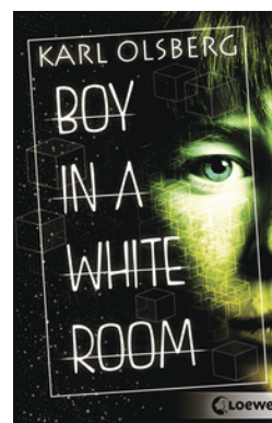
Boy in a White Room