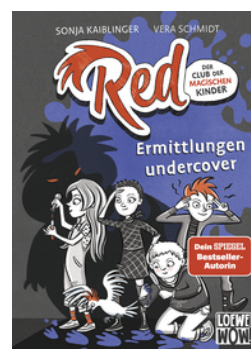
Red - Der Club der magischen Kinder (Band 2) - Ermittlungen undercover