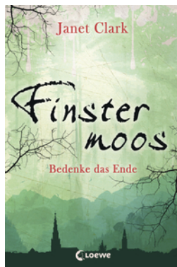
Finstermoos – Bedenke das Ende