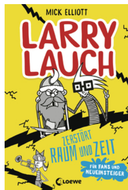
Larry Lauch zerstört Raum und Zeit