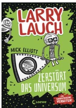
Larry Lauch zerstört das Universum (Band 2)