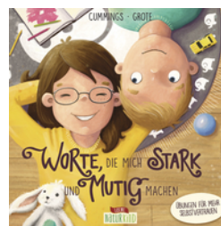
Worte, die mich stark und mutig machen