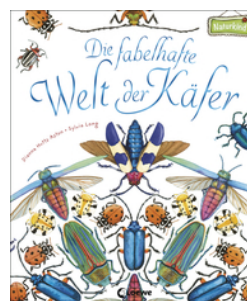
Die fabelhafte Welt der Käfer