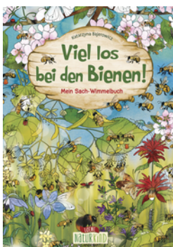
Viel los bei den Bienen!