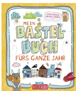
Mein Bastelbuch fürs ganze Jahr