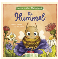
Mein erstes Naturbuch - Die Hummel