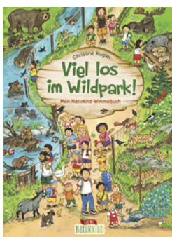
Viel los im Wildpark!