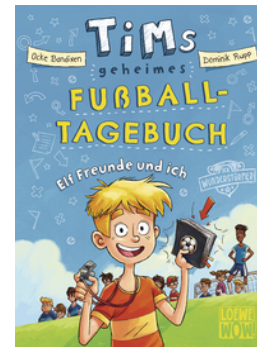
Tims geheimes Fußball-Tagebuch (Band 1) - Elf Freunde und ich!