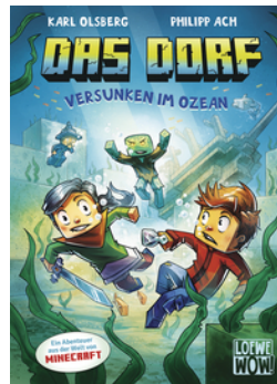
Das Dorf (Band 5) - Versunken im Ozean