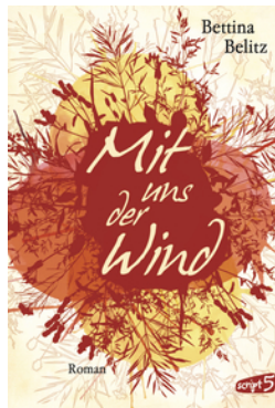
Mit uns der Wind