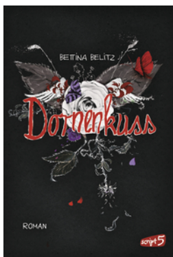
Splitterherz – Dornenkuss