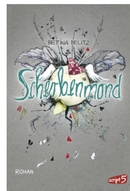
Splitterherz – Scherbenmond