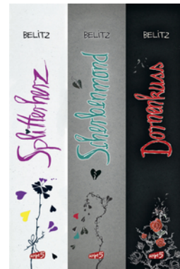
Splitterherz, Scherbenmond, Dornenkuss – Die komplette Trilogie