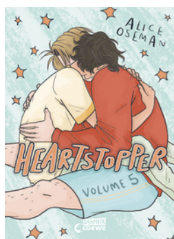
Heartstopper Volume 5 (deutsche Hardcover-Ausgabe)