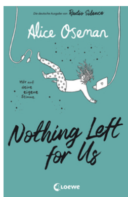
Nothing Left for Us (deutsche Ausgabe von Radio Silence)