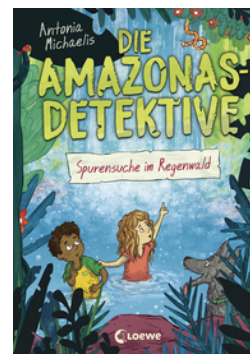
Die Amazonas-Detektive (Band 3) - Spurensuche im Regenwald