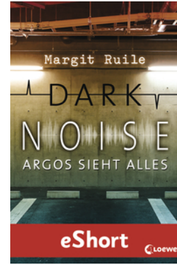
Dark Noise - Argos sieht alles