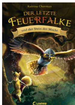
Der letzte Feuerfalke und der Stein der Macht (Band 1)