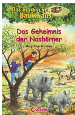
Das magische Baumhaus (Band 61) - Das Geheimnis der Nashörner