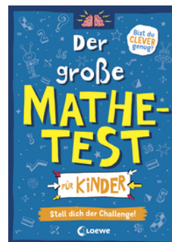
Der große Mathetest für Kinder - Stell dich der Challenge!