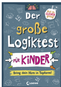
Der große Logiktest für Kinder - Bring dein Hirn in Topform!