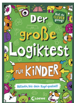
Der große Logiktest für Kinder - Rätseln, bis dein Kopf qualmt!