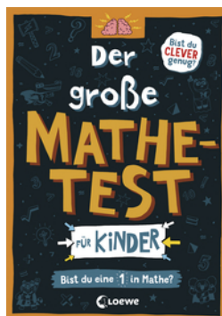
Der große Mathetest für Kinder - Bist du eine 1 in Mathe?