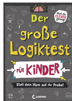
Der große Logiktest für Kinder - Stell dein Hirn auf die Probe!