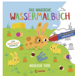
Das magische Wassermalbuch - Niedliche Tiere