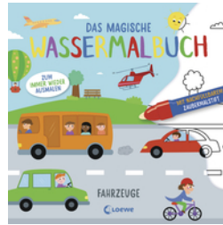
Das magische Wassermalbuch - Fahrzeuge