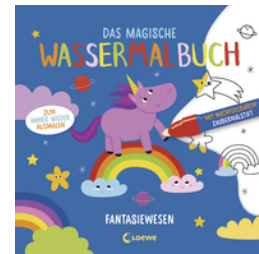
Das magische Wassermalbuch - Fantasiewesen