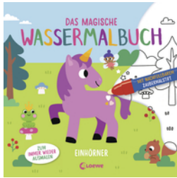
Das magische Wassermalbuch - Einhörner