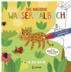
Das magische Wassermalbuch - In der Natur