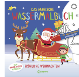
Das magische Wassermalbuch - Fröhliche Weihnachten!