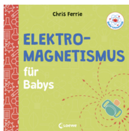
Baby-Universität - Elektromagnetismus für Babys