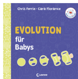
Baby-Universität - Evolution für Babys