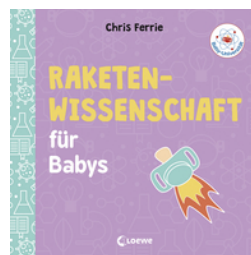
Baby-Universität - Raketenwissenschaft für Babys