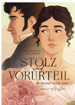
Stolz und Vorurteil - Die Graphic Novel nach Jane Austen