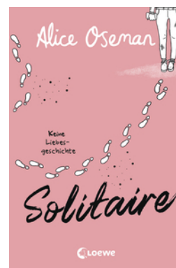
Solitaire (deutsche Ausgabe)