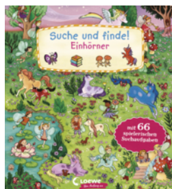
Suche und finde! Einhörner