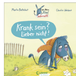
Der kleine Esel Lieber nicht - Krank sein? Lieber nicht!