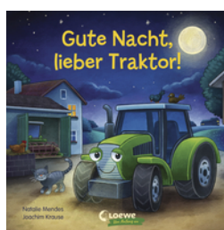
Gute Nacht, lieber Traktor!