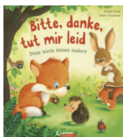
Bitte, danke, tut mir leid