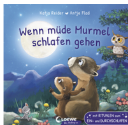
Wenn müde Marmel schlafen gehen