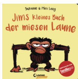
Jims kleines Buch der miesen Laune