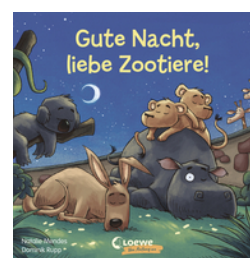
Gute Nacht, liebe Zootiere!