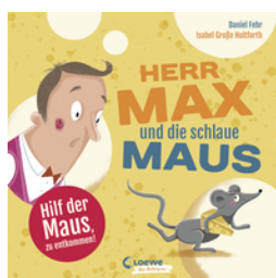
Herr Max und die schlaue Maus