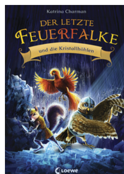
Der letzte Feuerfalk und die Kristalhöhlen (Band 2)