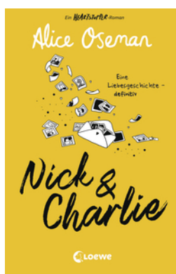
Nick & Charlie (deutsche Ausgabe)