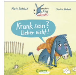
Der kleine Esel Liebernicht - Krank sein? Lieber nicht!