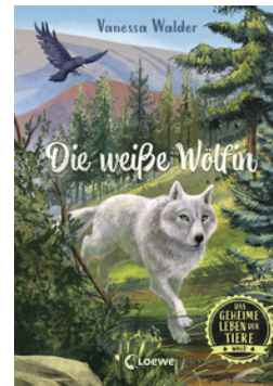
Das geheime Leben der Tiere (Wald) - Die weiße Wölfin