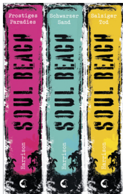
Soul Beach - Die komplette Trilogie