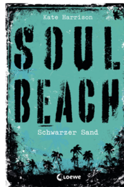
Soul Beach (Band 2) – Schwarzer Sand