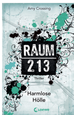
Raum 213 (Band 1) – Harmlose Hölle