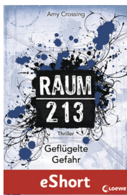
Raum 213 – Geflügelte Gefahr