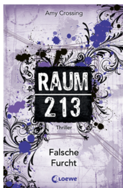
Raum 213 (Band 4) – Falsche Furcht