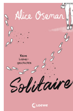
Solitaire (deutsche Ausgabe)