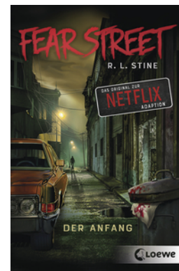
Fear Street - Der Anfang