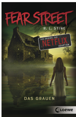
Fear Street - Das Grauen