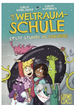
Die Weltraumschule (Band 1) - Erste Stunde: Alienkunde