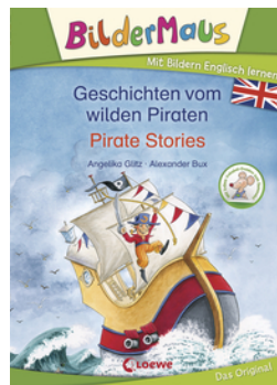
Bildermaus - Mit Bildern Englisch lernen - Geschichten vom wilden Piraten - Pirate Stories