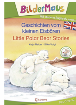
Bildermaus - Mit Bildern Englisch lernen - Geschichten vom kleinen Eisbären - Little Polar Bear Stories