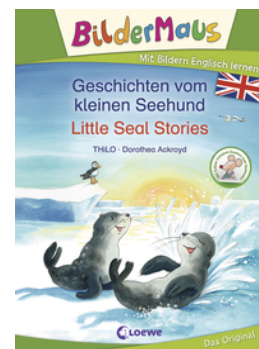
Bildermaus - Mit Bildern Englisch lernen - Geschichten vom kleinen Seehund - Little Seal Stories