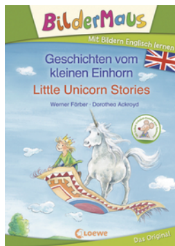
Bildermaus - Mit Bildern Englisch lernen - Geschichten vom kleinen Einhorn - Little Unicorn Stories