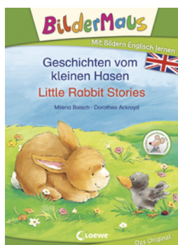
Bildermaus - Mit Bildern Englisch lernen - Geschichten vom kleinen Hasen - Little Rabbit Stories