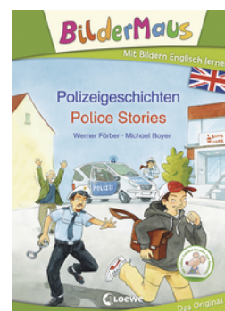
Bildermaus - Mit Bildern Englisch lernen - Polizeigeschichten - Police Stories