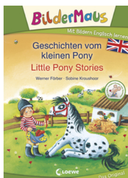
Bildermaus - Mit Bildern Englisch lernen - Geschichten vom kleinen Pony - Little Pony Stories