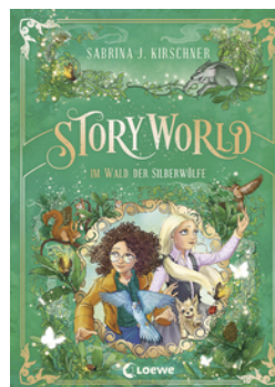
StoryWorld (Band 2) - Im Wald der Silberwölfe