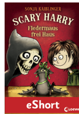
Scary Harry - Fledermaus frei Haus