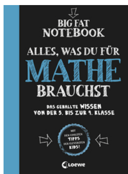
Big Fat Notebook - Alles, was du für Mathe brauchst - Das geballte Wissen von der 5. bis zur 9. Klasse