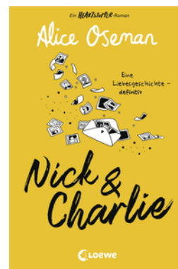
Nick & Charlie (deutsche Ausgabe)