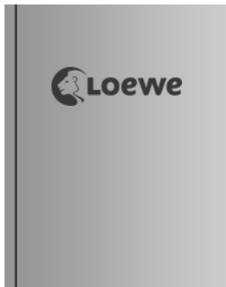
Good Morning Sunshine 02