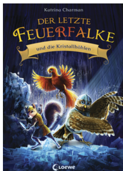
Der letzte Feuerfalken und die Kristallhöhlen (Band 2)