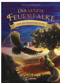
Der letzte Feuerfalken und die flüsternde Eiche (Band 3)