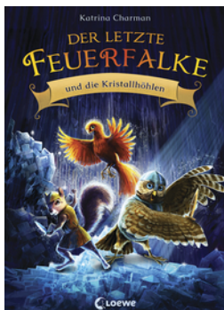
Der letzte Feuerfalken und die Kristallhöhlen (Band 2)