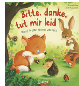
Bitte, danke, tut mir leid