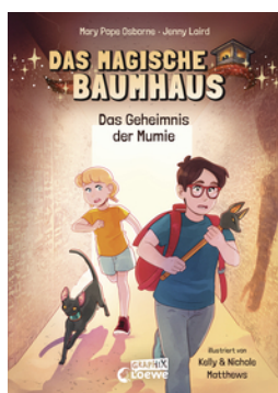
Das magische Baumhaus (Comic-Buchreihe, Band 3) - Das Geheimnis der Mumie