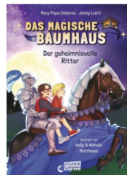
Das magische Baumhaus (Comic-Buchreihe, Band 2) - Der geheimnisvolle Ritter