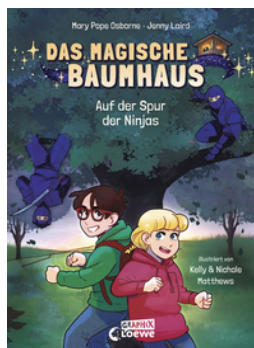
Das magische Baumhaus (Comic-Buchreihe, Band 5) - Auf der Spur der Ninjas