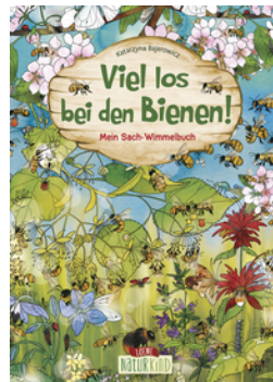
Viel los bei den Bienen!