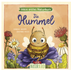
Mein erstes Naturbuch - Die Hummel