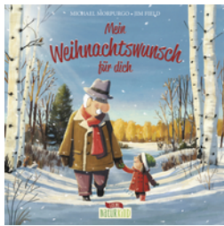
Mein Weihnachtswunsch für dich