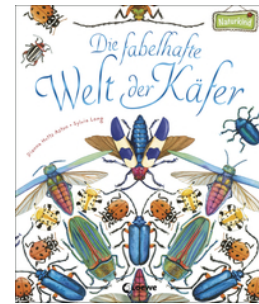
Die fabelhafte Welt der Käfer