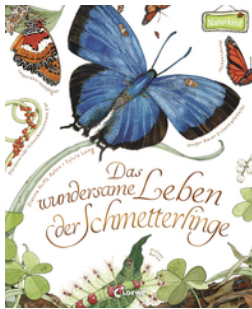
Das wundersame Leben der Schmetterlinge