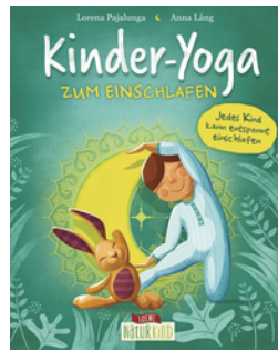
Kinder-Yoga zum Einschlafen