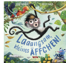
Laaangsam, kleines Äffchen!