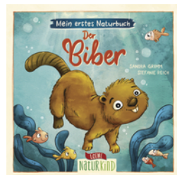
Mein erstes Naturbuch - Der Biber