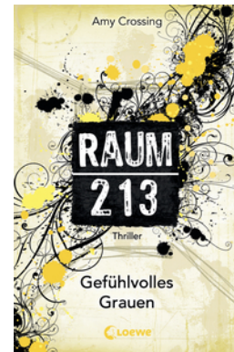
Raum 213 (Band 3) – Gefühlvolles Grauen