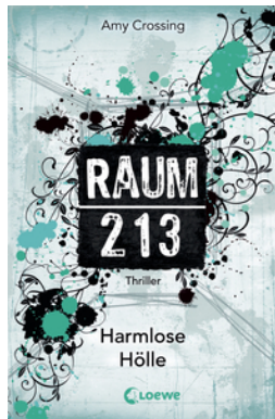
Raum 213 (Band 1) – Harmlose Hölle