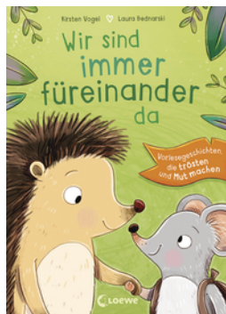
Wir sind immer füreinander da