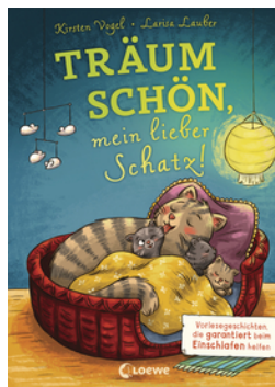
Träum schön, mein lieber Schatz!