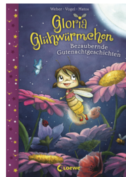
Gloria Glühwürmchen (Band 1) - Bezaubernde Gutenachtgeschichten