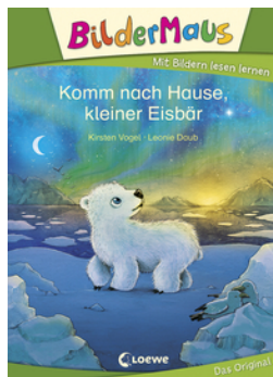
Bildermaus - Komm nach Hause, kleiner Eisbär