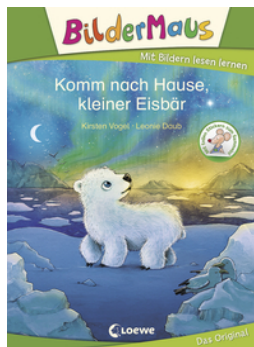
Bildermaus - Komm nach Hause, kleiner Eisbär