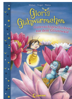
Gloria Glühwürmchen (Band 2) - Gutenachtgeschichten aus dem Glitzerwald